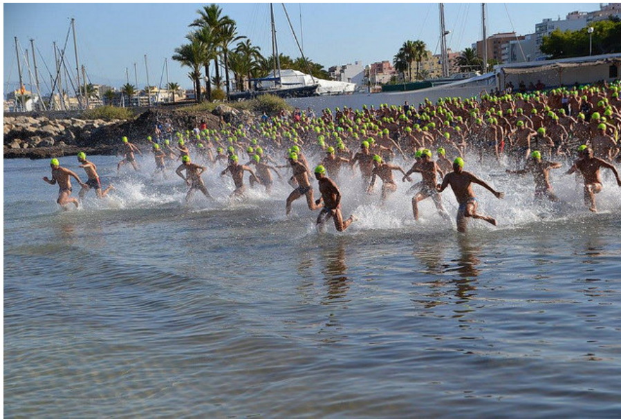
Participantes de la XII Sa Milla 2015

Gracias por participar y disfrutad de esta bonita travesía.