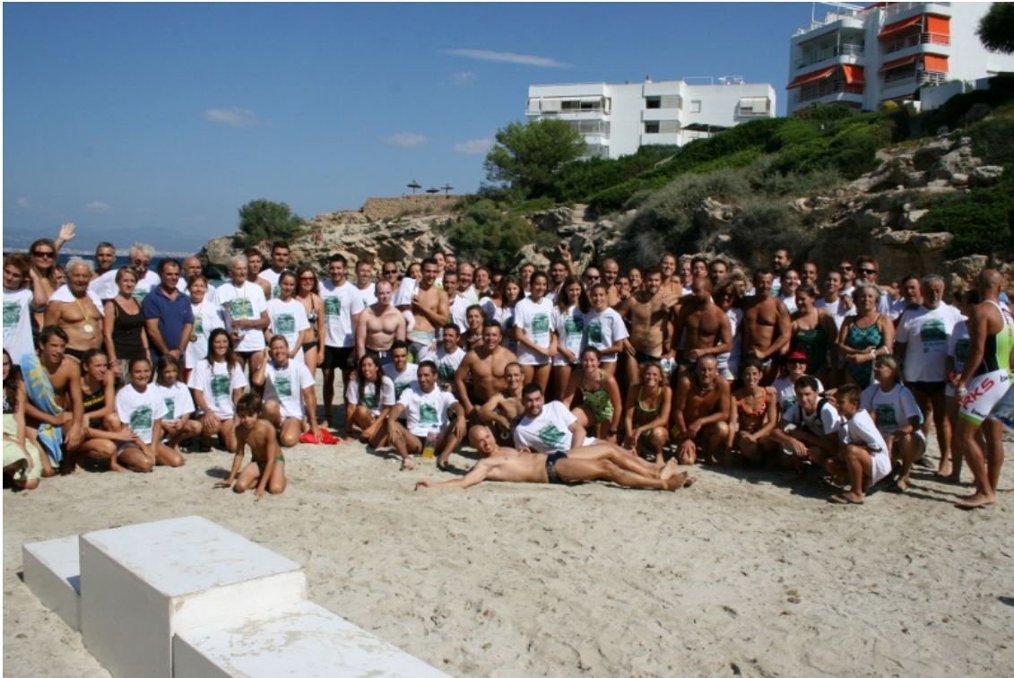
Participants X Sa Milla (agost 2013)

Gràcies per participar i gaudiu d'aquesta bella travessia.