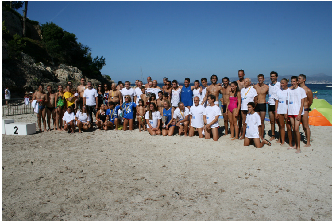
Participantes de la XI Sa Milla - 2014

Gracias por participar y disfrutad de esta bonita travesía.